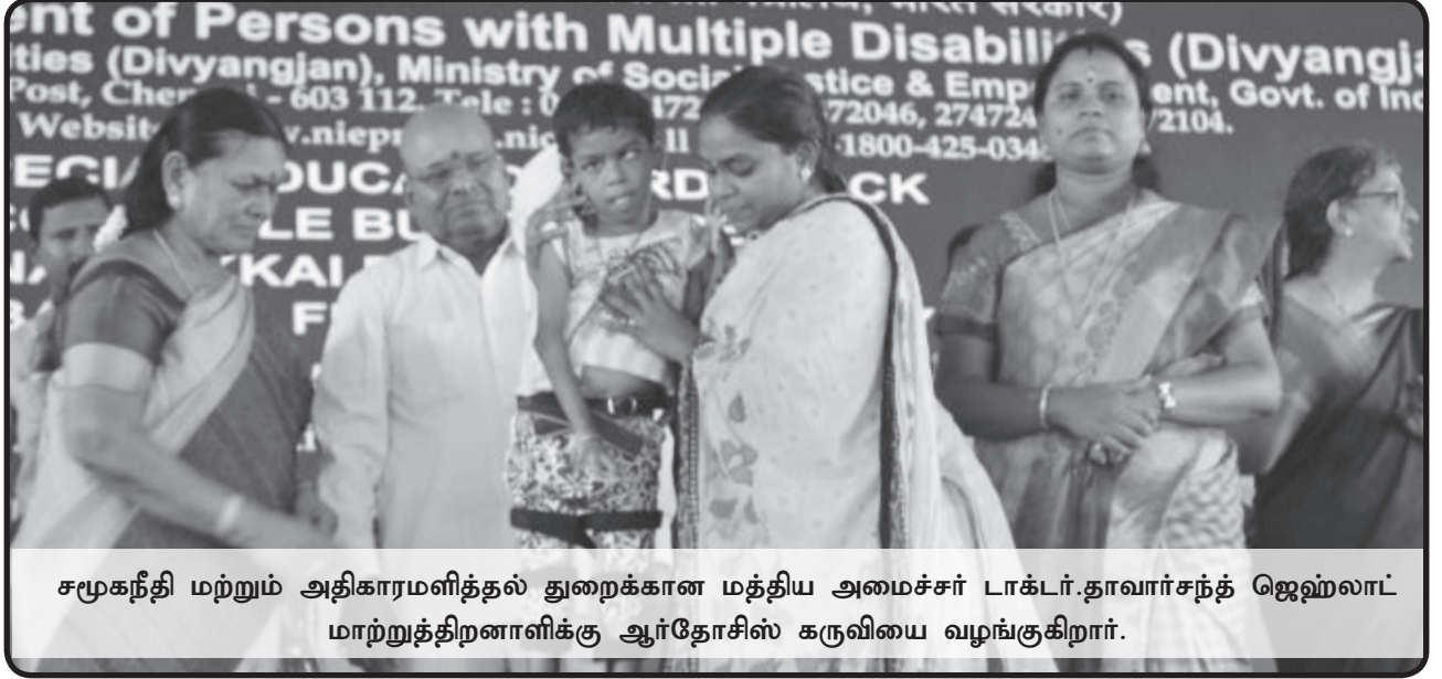
சமூகநீதி மற்றும் அதிகாரமளித்தல் துறைக்கான மத்திய அமைச்சர் டாக்டர்.தாவார்சந்த் ஜெஹ்லாட் மாற்றுத்திறனாளிகளுக்கு ஆர்தோசிஸ் கருவியை வழங்குகிறார்.

பயனாளிகள், அவர்களின் குடும்பத்தினர், தொழில்முறைப் பணியாளர்கள், தாழ்த்தப்பட்ட, பழங்குடியின மாற்றுத்திறனாளிகள்